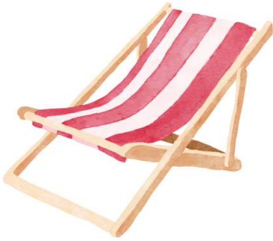
ξαπλώστρα sun lounger