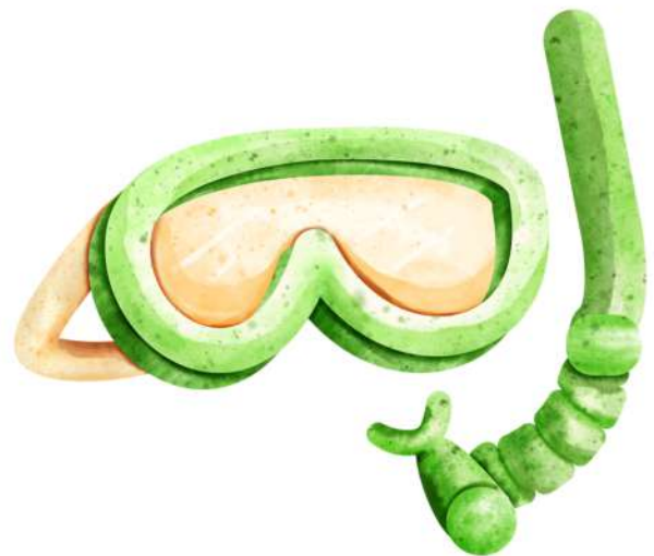
μάσκα diving mask